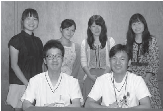
お二人と編集委員

しかったのか、絶対あとで悔やんでしまうと思うので。仕事に関わらず、コミュニケーションはどこにおいても大事なんだなとつくづく感じます。