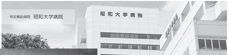
特定機能病院 昭和大学病院