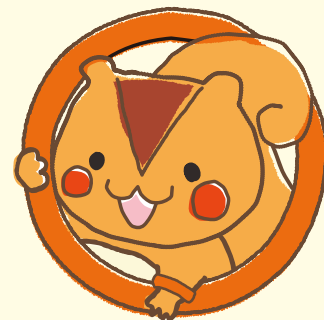
認知症対策の普及啓発 キャラクターくるみちゃん