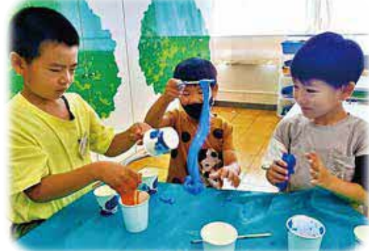
スライム作りを初体験!