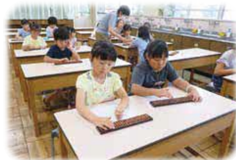
ねがいましては～ そろばん教室