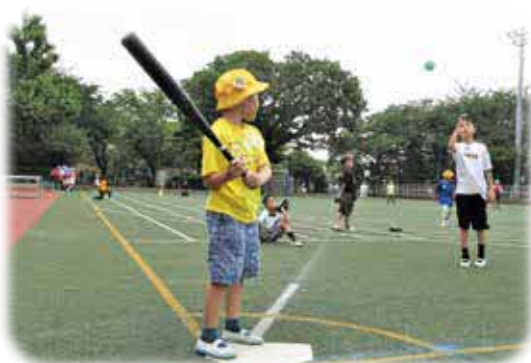
天気の良い日は校庭で遊んじゃおう!

クラスや学年を超えた子どもたちが、共に遊んだり、読書したり、学習したりと自由に過ごす時間です。活動場所は、すまいるスクールのスペースのほか、校庭や体育館、特別教室などです。