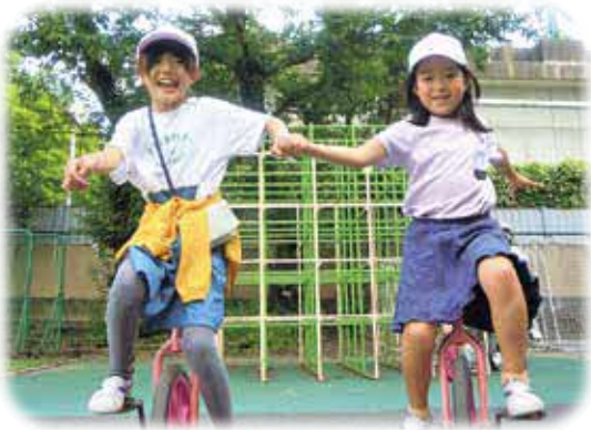
一輪車もお手のもの!