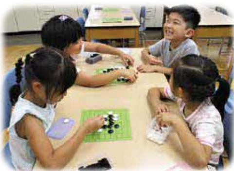
伝統に触れる ～囲碁教室～

子どもたちが様々な体験をする場です。日本の伝統文化、スポーツ、環境や音楽などの情操教育、ものづくりの教室など、様々な教室が行われています。これらの教室は、地域ボランティア、PTAの方々などの協力のほか、すまいるスクール指導員の企画により実施されています。発表会やお楽しみ会などのイベントもあります。