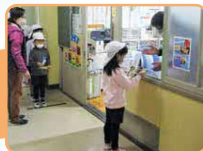
保育園児のすまいるスクール体験