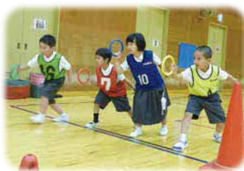
運動会スタートダッシュで 差をつける!