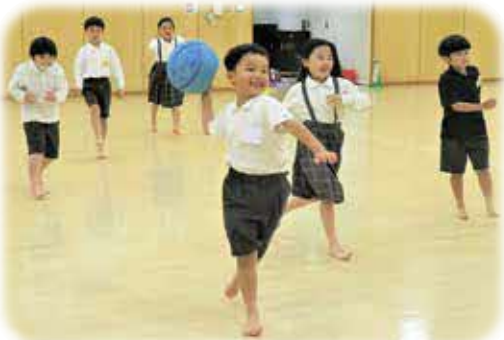
ドッジボール! よ〜く狙って!