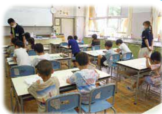
みんなで宿題終わらせちゃおう!