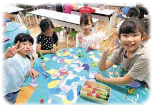
みんなで作れば楽しいね!!