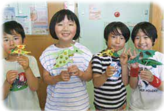
動くペテラドンを作ったよ♪