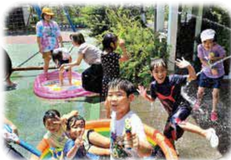
夏といえば水遊び!