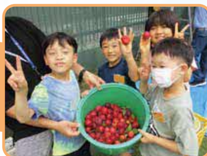
おいしくできたよ! ガーデニングクラブのミニトマト