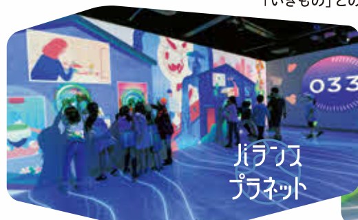
バランス プラネット

壁全面を使った大型映像で、都市と自然の「バランス」や「いきもの」とのふれあいを体験してみよう!