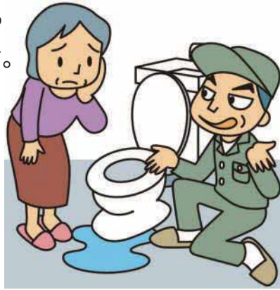
消費者庁イラスト集より